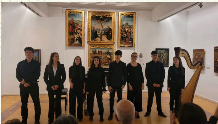
Museo Bellas Artes de Murcia